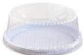
G50M EMB. GALVANOTEK TORTA PEQ. MEDIA 1,5KG