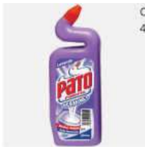
DESINF. PATO GERMINEX LAVANDA 500ML