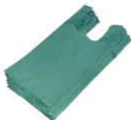
SACOLA PLAST. VERDE 40X50