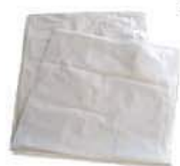
SACO LIXO DINAP. BRANCO REFORC. 100LTS 100UN