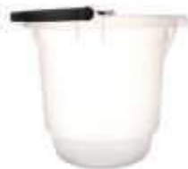
BALDE PLAST. RAINHA 10LT REF. 156 TRANSP.