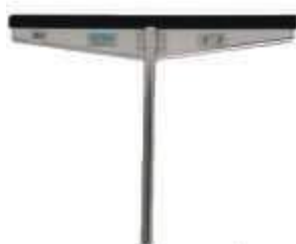
RODO SANCHES ALUMÍNIO