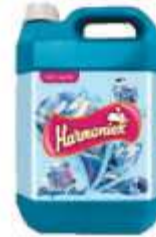
SAB. LIQ. HARMONIEX BUQUE AZUL 5LT