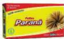
PALITO DENTE PARANA GRANEL C/5000