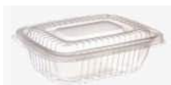
G303 EMB. GALVANOTEK POTE RET FREZ/MICR 400ML