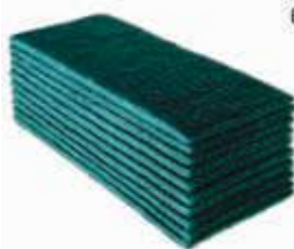
FIBRA LIMP. BETTANIN LIMP. GERAL 102X260 UM