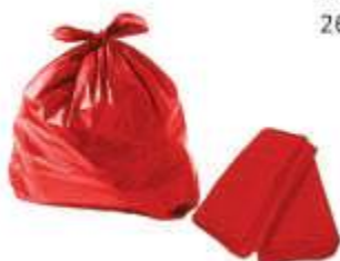
SACO LIXO DINAP. VERMELHO REFORC. 100LTS 100UN