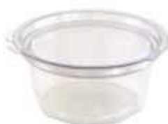
G771D EMB. GALVANOTEK POTE RED TP ARTIC. DIAM. 500ML