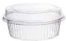
G640 EMB. GALVANOTEK UM DOCE RED 170ML 10UN