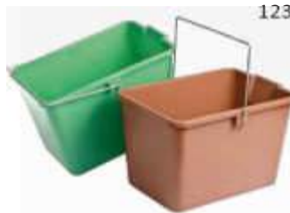
BALDE RET. REFORC. 12LT REF. 182