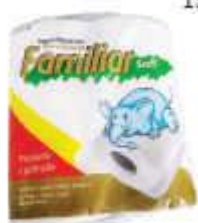
PAPEL HIG FAMILIAR NEUTRO F.S. 4X30MTS