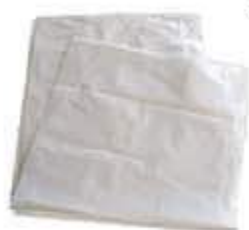
SACO LIXO DINAP. BRANCO REFORC. 40LTS 100UN