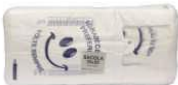
SACOLA PLAST. RIOPLASTIC 38X50 V. SEMPRE FD C/1000