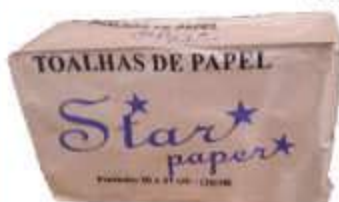
PAPEL TOALHA INTERF STAR PAPER BRANCO 20X21 C/1000UN