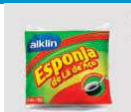
LA DE ACO ALKLIN 40GR C/6