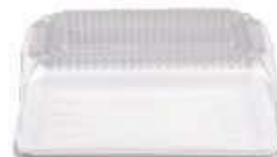
G65M EMB. GALVANOTEK TORTA RET. PEQ. 2KG