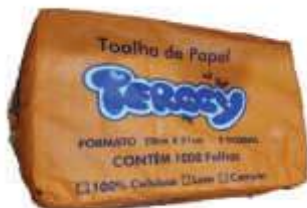
PAPEL TOALHA INTERF TERCCY BRANCO 20X21 C/1000UN