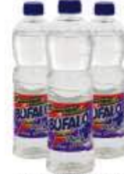
REMOVEDOR BUFALO 500ML