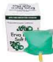
SAB. LIQ. TRILHA REFIL 800ML