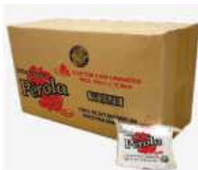
GUARDANAPO PAPEL PEROLA 18X19,5 C/100