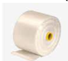
BOB. PLAST. PIC. FUNDO ESTRELA 40X60 AZUL