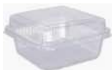
G650 EMB. GALVANOTEK UM DOCE QUAD 200ML 10UN