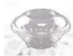
G25I EMB. GALVANOTEK MINI SALADEIRA 500ML