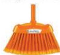
VASSOURA BETTANIN MULTIUSO C/CABO