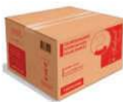
GUARDANAPO PAPEL INDAIAL INTERF. 10X20 C/14400