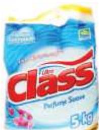
DET.PO ULTRA CLASS 5KG