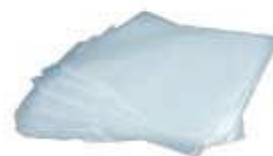
SACO PLAST. LEITOSO LANCHE 21X19