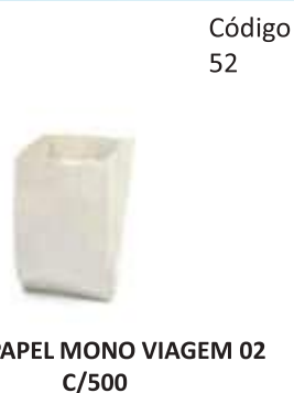
SACO PAPEL MONO VIAGEM 02 C/500