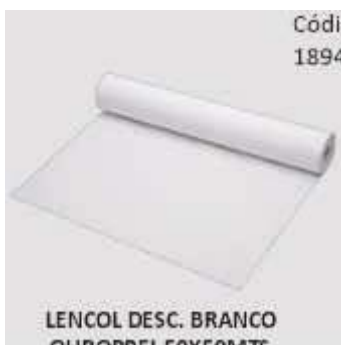
LENCOL DESC. BRANCO OUROPPEL 50X50MTS