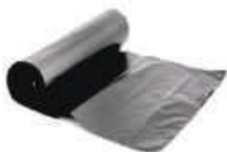
SACO LIXO DINALIX PRETO ROLO 15LTS 60UN