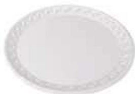
PRATO ISOPOR MEIWA MP28 UNIT