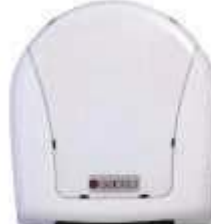
SUPORTE PAPEL HIG. ROLAO EXACCTA BRANCO