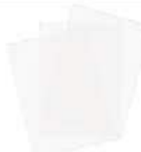
PAPEL MANTEIGA 50X70 C/400