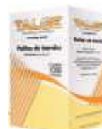
PALITO DENTE TALGE SACHET C/1000