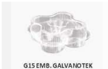
G15 EMB. GALVANOTEK QUATRO DOCES MILLEN