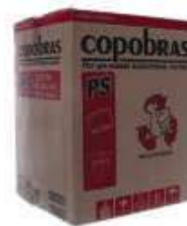
POTE DESC. COPOBRAS 250ML TRANSP PP. C/50