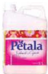
SAB.LIQ. PETALA E. DOCE PRONTO USO 5LT