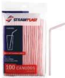
CANUDO STRAWPLAST FLEX VERM. 6MM C/100 CS-210