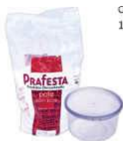
POTE PRAFESTA RED. 1000ML C/LACRE TRANSP C/10 8809