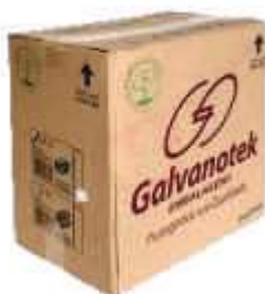
G650 EMB. GALVANOTEK UM DOCE QUAD 200ML CX300UN