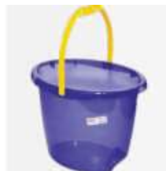
BALDE PLASNEW OVAL 18LT REF.7018