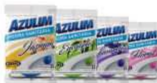
PEDRA SANITARIA AZULIM 25GR