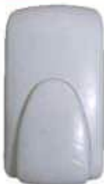
SABONETEIRA MONTANA C/ RESERV. BRANCA