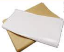
PAPEL MANILHA JORNAL 40X60