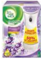
PURIF. BOM AR FRESHMATIC APAR.LAV.GTS REFIL