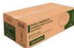
PAPEL HIG INDAIAL CAI CAI F.D.CX C/8000 E. LUXO