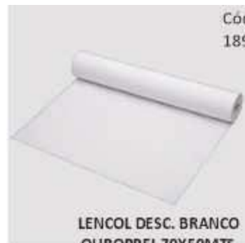
LENCOL DESC. BRANCO OUROPPEL 70X50MTS