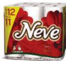
PAPEL HIG NEVE FL. DUPLA 30 MTS LV12 PG11