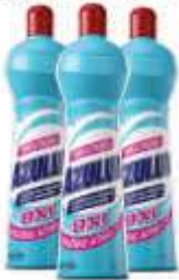
LIMP. AZULIM M. USO 550ML