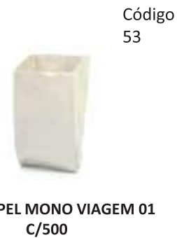
SACO PAPEL MONO VIAGEM 01 C/500