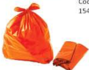
SACO LIXO LARANJA REFORC. 60LTS 50UN