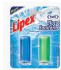
BLOCO SANITARIO LIPEX REFIL C/02