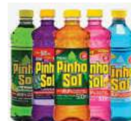
DESINF. PINHO SOL 500ML