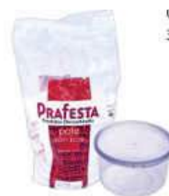
POTE PRAFESTA RED. 145ML TRANSP C/24 8416