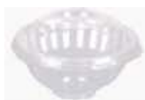
G680 EMB. GALVANOTEK SOBREMESA IDEAL 250ML 10UN