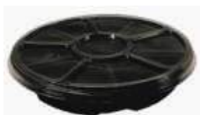
G550 EMB. GALVANOTEK BANDEJA C/ DIVISORIAS