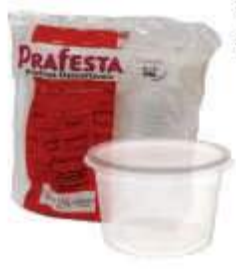
POTE PRAFESTA RED. 250ML TRANSP C/24 8202