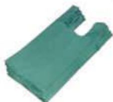
SACOLA PLAST. VERDE 30X40