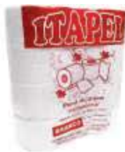
PAPEL HIG ROLAO ITAPEL BRANCO 8 ROLOS