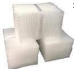
PLASTICO BOLHA PACOTE 10MT