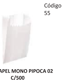
SACO PAPEL MONO PIPOCA 02 C/500