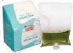
SAB. ESPUMA EXACCTA E.DOCE REFIL 500ML