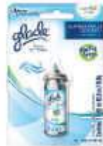
PURIF. GLADE TOQ. FRESCOR REF 12ML