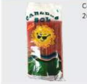
CANUDO SOL VITAMINA 120GR C/200