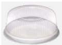
G35MA EMB. GALVANOTEK TORTA BOLO 15CM ALTA 500GR