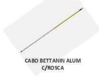
CABO BETTANIN ALUM C/ROSCA