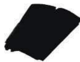
SACO LIXO PRETO REFORC. 100LTS C/08