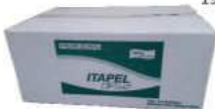
PAPEL TOALHA BOB. ITAPEL LUXO CX 6X200