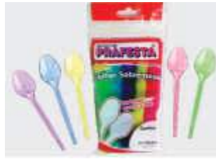
COLHER PRAFESTA SOBREMESA COLOR C/50 9952