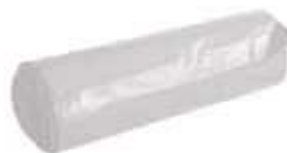
SACO LIXO DINAP. BRANCO 30LTS 50UN