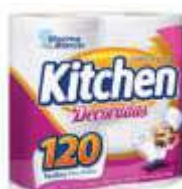
PAPEL TOALHA KITCHEN DECORADA 19X22 60FL 02 RL