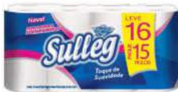
PAPEL HIG SULLEG NEUTRO F.S. 30MT LV16 PG15