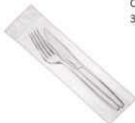
SACO PLASTICO TALHER 6X23 C/1000