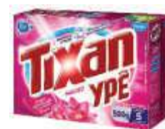
DET.PO TIXAN 500GR