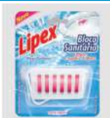
BLOCO SANITARIO LIPEX APAR.