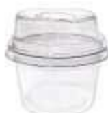
G670M EMB. GALVANOTEK MOUSSE ALTA 110ML 10UN