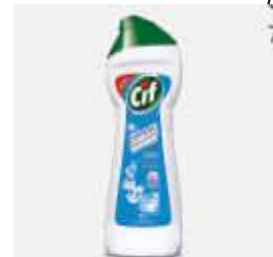
LIMP. CIF DESENG. CREMOSO 250ML