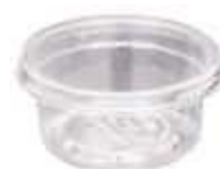
G675B EMB. GALVANOTEK MOUSSE BAIXA 70ML 10UN