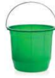
BALDE ARQPLAST 8LT REF. BF08