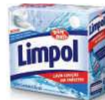
DET.PO LIMPOL MAQ.LAVAR LOUCAS 1KG