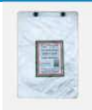
FOLHA PLAST. BLOCADA 30X40