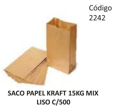
SACO PAPEL KRAFT 15KG MIX LISO C/500