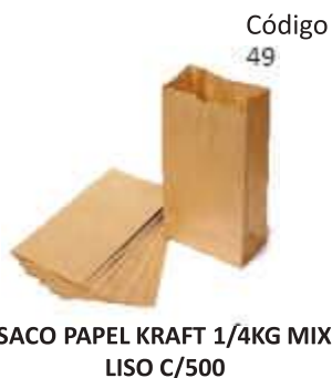
SACO PAPEL KRAFT 1/4KG MIX LISO C/500