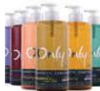
SAB.LIQ. ONLY 500ML