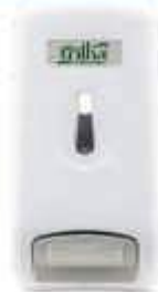
SABONETEIRA TRILHA BRANCA