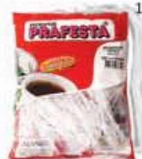
MEXEDOR DRINK PRAFESTA CRISTAL C/500 8110