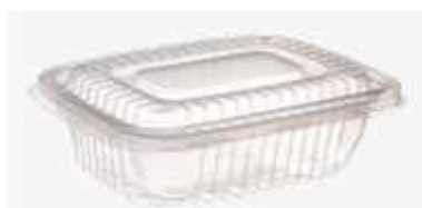
G302 EMB. GALVANOTEK POTE RET FREZ/MICR 700ML