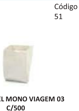
SACO PAPEL MONO VIAGEM 03 C/500