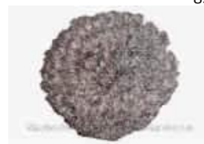
ENPONJA SCOTH BRITE METALICA ESPIRAL C/ 1UN