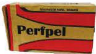
PAPEL TOALHA INTERF PERFPEL BRANCO 20X21 C/1000UN