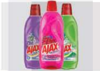
LIMP. AJAX 500ML