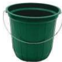
BALDE ARQPLAST 20LT REF. BF20