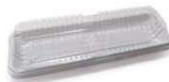
G63M EMB. GALVANOTEK TORTA BOLO FATIA 400GR