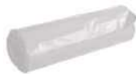
SACO LIXO DINALIX BRANCO PIA E BRANHEIRO