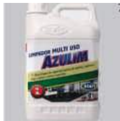
LIMP. AZULIM MULTIUSO 5LT