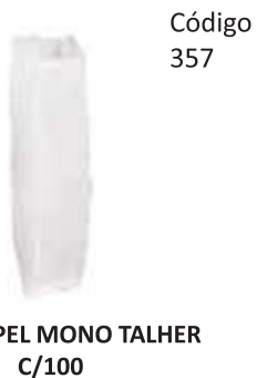
SACO PAPEL MONO TALHER C/100