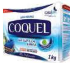
DET.PO COQUEL 1KG