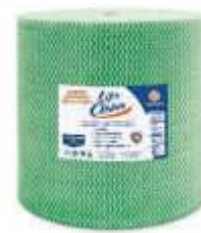
PANO M. USO LIFE CLEAN