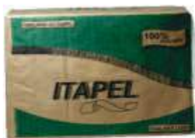
PAPEL TOALHA INTERF ITAPEL BRANCO LUXO 21X23 C/1000UN