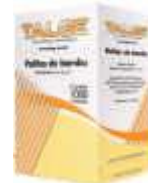
PALITO DENTE TALGE SACHET C/1000