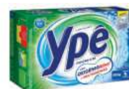
DET.PO YPE PREMIUM CX 1KG