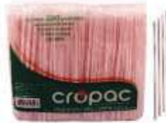
CANUDO CROPAC SACHE FLEX VERM 5,8MM CX 3000 CA-541