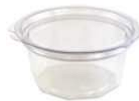
G775D EMB. GALVANOTEK POTE RED TP ARTIC. DIAM. 750ML