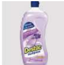
LIMP. DESTAC MULTIPISO LAVANDA 500ML