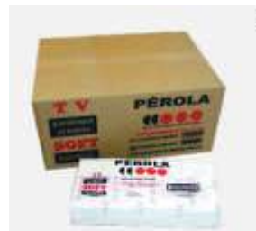
GUARDANAPO PAPEL PEROLA TV 13X14 C/2000