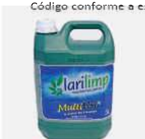
LIMP. LARILIMP MULTIUSO 5LT