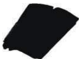
SACO LIXO DINAP. PRETO REFORC. 20LTS 100UN