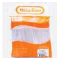
MEXEDOR CAFÉ MEXA BEM C/500