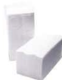
PAPEL TOALHA INTERF 3 DOBRAS E.LUXO 23X23,5C/1250