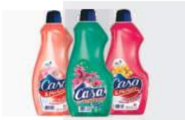
LIMP. CASA PERFUME 1LT