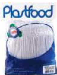
MEXEDOR DRINK PLASTFOOD CRISTAL C/500