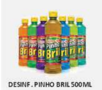
DESINF. PINHO BRIL 500ML