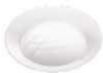
PRATO PRAFESTA RED. MEDIO CRISTAL C/10 8061