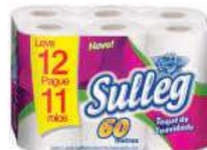
PAPEL HIG SULLEG NEUTRO F.S. 30MT LV12 PG11