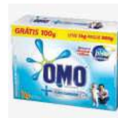
DET.PO OMO P.CUIDADO CX 1KG