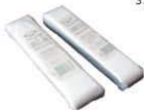
SACO PLÁSTICO GELADINHO 4X23 C/1000