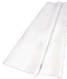
TOALHA MESA PEROLIZ. 60X60 10UN BCA