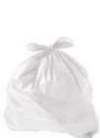
SACO LIXO BRANCO RECICL. 60LTS 50UN