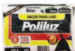
SACO LIXO PRETO POLILUZ 100LTS C/05