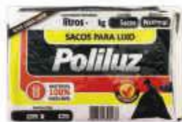
SACO LIXO PRETO POLILUZ 30LTS C/10