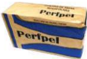
PAPEL TOALHA INTERF PERFPEL CREME 20X21 C/1000UN