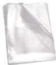
SACO PLASTICO VIRGEM BD 15X20