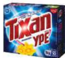
DET.PO TIXAN 1KG