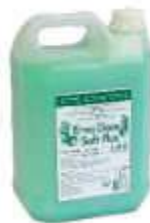
SAB. LIQ. TRILHA 5LT