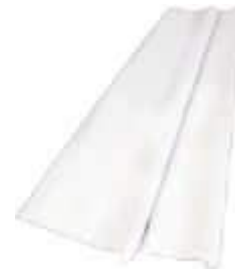
TOALHA MESA PEROLIZ. 80X80 10 UM BCA