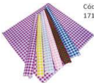
TOLHA MESA PEROLIZ. 80X80 10UN COLOR