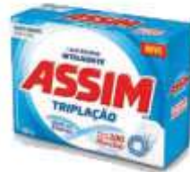
DET.PO ASSIM TRAD. CX 1KG