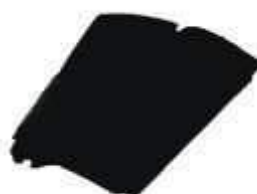
SACO LIXO PRETO REFORC. 40LTS FD GRANDE