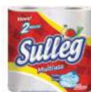
PAPEL TOALHA SULLEG 120 FOLHAS C/2 ROLOS