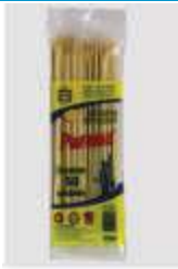
ESPETO BAMBU PARANÁ 18CM C/50