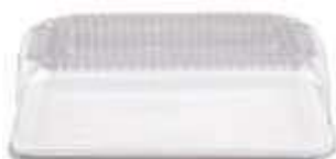
G65MB EMB. GALVANOTEK TORTA RET PEQ. BX 1,5KG