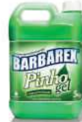
LIMP. BARBAREX PINHO GEL 5LT