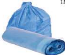
SACO LIXO DINAP. AZUL ROLO 15LTS 100UN