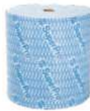
PANO M.USO BETTANIN