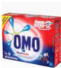
DET.PO OMO M.ACAO TRAD. CX 1KG