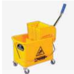
BALDE ESPREM. BETTANIN C/ALAV.LATERAL 33LT