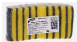
ESPONJA D.FACE 3M C/10