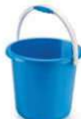
BALDE PLAST. RAINHA 10LT REF. 8156 COLOR