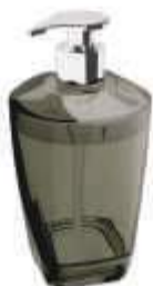
SABONETEIRA UZ. PREMIUM PRETA LIQ. 500ML