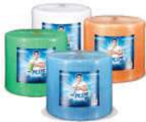
PANO M.USO MR. PLUS ROLO