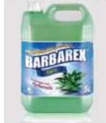
DESINF. BARBAREX 5LT