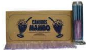
CANUDO MAMBO MILK SACHE 8MM