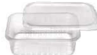
POTE PRAFESTA RET. 1.500ML C/TP TRANSP. C/24 8326