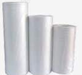
BOB. PLAST. PICOTADA