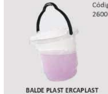
BALDE PLAST ERCAPLAST GRADUADO 18LT REF. 182