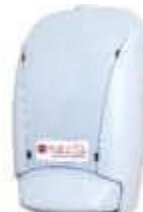
SABONETEIRA EXACCTA C/ RESERV. BRANCA