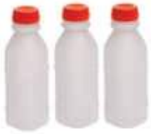
GARRAFA PLAST. C/TP C/100UN