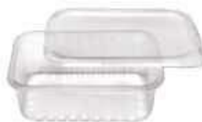
POTE PRAFESTA RET. 1.000ML C/TP TRANSP. C/24 8321