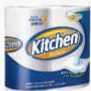
PAPEL TOALHA KITCHEN BCA 19X22 60FL 02 RL