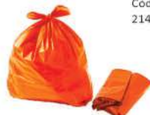
SACO LIXO LARANJA REFORC. 20LTS 100UN