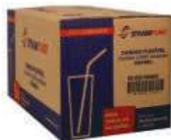
CANUDO STRAWPLAST FLEX VERM. 6MM CX2000 CS-202