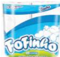
PAPEL HIG FOFINHO 4X30 NEUTRO