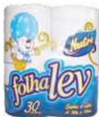
PAPEL HIG FOLHALEV F.S. 4X30MT