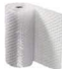
PLASTICO BOLHA BOBINA 1,30X100MT