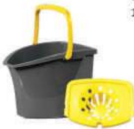
BALDE PLASNEW P/ESFREGAO CINZA 13LT REF. 182