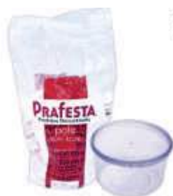
POTE PRAFESTA RED. 500ML C/LACRE TRANSP C/10 8231