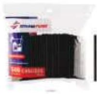
CANUDO STRAWPLAST DRINK PRETO C/500 CS-220P