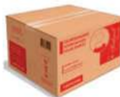
GUARDANAPO PAPEL INDAIAL INTERF. 10X20 C/14400