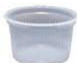
POTE DESC. COPOPLAST 200ML TRANSP. C/50