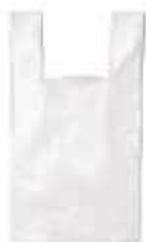
SACOLA PLASTICA 30X50 PCTE 2,5KG