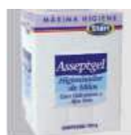
HIG.MAOS ASSEPTGEL REFIL 700GR