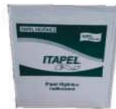
PAPEL HIG ROLAO ITAPEL MACIO BRANCO C/8 ROLOS