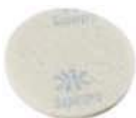
DISCO LUSTRADOR BETTANIN BRANCO 35CM