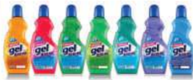
LIMP. AZULIM GEL 500GR