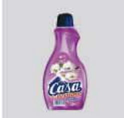
LIMP. CASA PERFUME 500ML