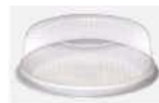
G35M EMB. GALVANOTEK TORTA BOLO 15CM MEDIA 500GR