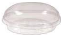
G34P EMB. GALVANOTEK MINI COLOMBA IDEAL 1000ML