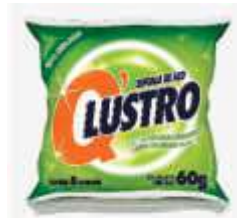
LA DE ACO Q-LUSTRO 60GR C/08