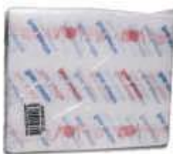
TOALHA AMERICANA MONO IMPRESSA 25X35 C/500UN