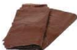
SACO LIXO MARROM REFORC. 60LTS 50UN