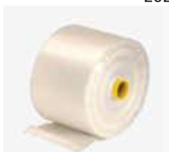
BOB. PLAST. PIC. FUNDO ESTRELA 35X45 LARANJA