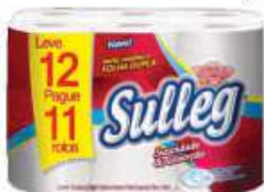
PAPEL HIG SULLEG NEUTRO F. DUPLA LV12 PG11