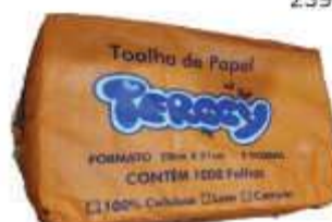
PAPEL TOALHA INTERF TERCCY 100% CEL 20X21 C/1000UN