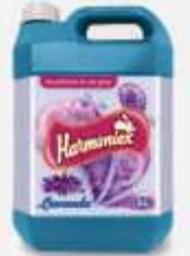
DESINF. HARMONIEX 5LT