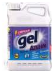
LIMP. AZULIM GEL 5LT