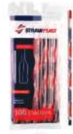
CANUDO STRAWPLAST SACHE 26CM 5MM C/100 CS-316