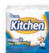
GUARDANAPO PAPEL KITCHEN 22,7X22,8 C/50