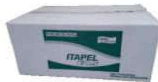
PAPEL TOALHA BOB. ITAPEL 100% CELULOSE CX 6X200