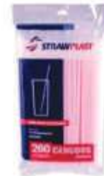
CANUDO STRAWPLAST COMUM VERM 5MM C/200UN CC-002