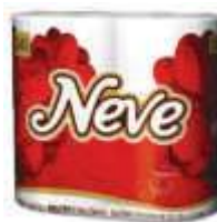
PAPEL HIG NEVE FL. DUPLA 4X30