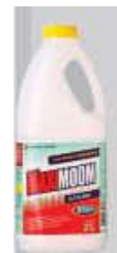
LIMP. START MAXIMOON 2LT