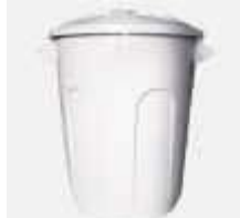
CESTO JAGUAR BRANCO