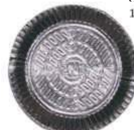
PRATO LAMINADO PLAC NR.6