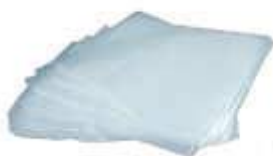
SACO PLAST. LEITOSO LANCHE 15X20