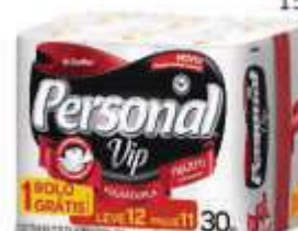
PAPEL HIG PERSONAL VIP F. DUPLA LV12 PG11