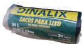
SACO LIXO PRETO DINALIX 30LTS C/10