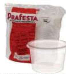
POTE PRAFESTA RED. 350ML TRANSP C/24 8221