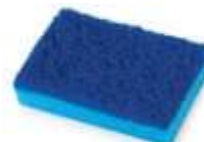
ENPONJA BETTANIN ANTIAD.TEFLON UN AZ