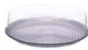
G50MB EMB. GALVANOTEK TORTA PEQ. BAIXA 1,2KG