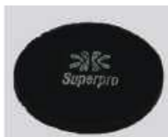
DISCO REMOVEDOR BETTANIN PRETO 35CM