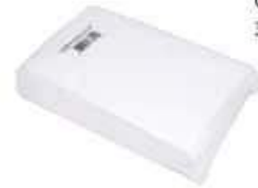
TOALHA AMERICANA BRANCA LISA C/500UN