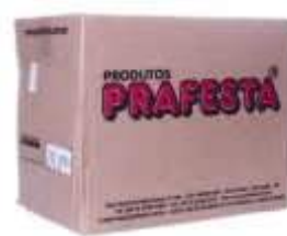
COLHER PRAFESTA LITTLE COFFE CRISTAL C/1000 8779