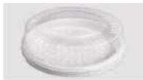
G32MB BEM. GALVANOTEK TORTA MINI MILLEN BAIXA 700GR