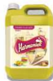
LIMP. HARMONIEX MULTIUSO 5LT