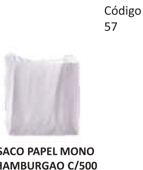
SACO PAPEL MONO HAMBURGAO C/500