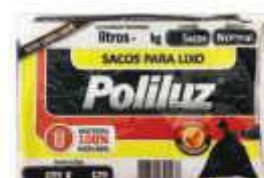
SACO LIXO PRETO POLILUZ 15LTS C/10