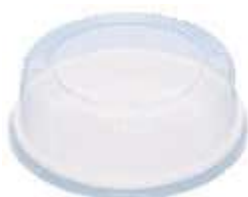
G56MB EMB. GALVANOTEK TORTA MEDIA BX 2,2