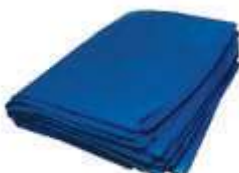
SACO LIXO DINAP.AZUL REFORC. 100LTS 100UN