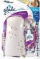
PURIF. GLADE TOQ. FRESCOR APARELHO