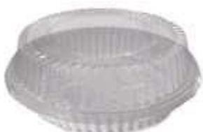
G40M EMB. GALVANOTEK PUDIM ALTO 1,4KG