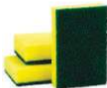
ESPONJA BETTANIN MULTIUSO C/3UN