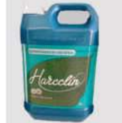
DESINF. HARCCLIN 5LT