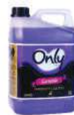
SAB. LIQ. ONLY 5LT