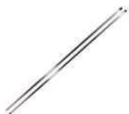
CABO ALUMINIO SANCHES C/ROSCA