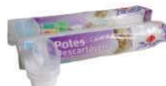
POTE DESC. ZANATTA 450ML TRANSP. C/50