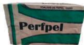
PAPEL TOALHA INTERF PERFPEL BRANCO LUXO 20X21 C/1000UN