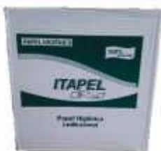
PAPEL HIG ROLAO ITAPEL 100% CELULOSE 8 ROLOS