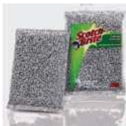
ENPONJA SCOTH BRITE PRATEADA