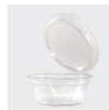
G742D POTE GALVANOTEK RED DIAM 250ML