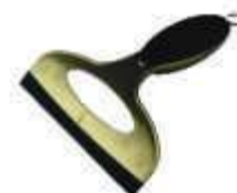
RODO PIA PLASTICO