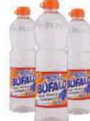
QUEROSENE BUFALO 500ML