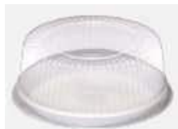
G37MA EMB. GALVANOTEK TORTA PEQ. 1,2KG ALTA