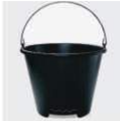
BALDE ARQPLAST REFORC. PRETO 12LT REFBC12