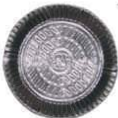
PRATO LAMINADO PLAC NR.5