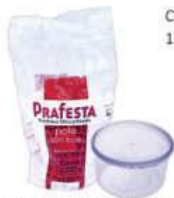
POTE PRAFESTA RED. 250ML C/LACRE TRANSP C/10 8801