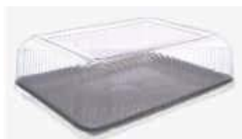
G70M EMB. GALVANOTEK TORTA RET. GDE. 3KG