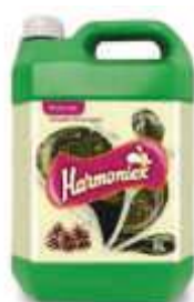
LIMP. HARMONIEX PINHO GEL 5LT