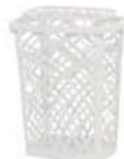
CESTO JAGUAR TELADO RETANG. C/TP