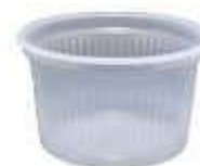
POTE DESC. COPO PLAST 225ML TRANSP. C/50