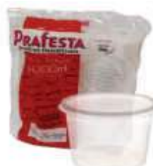
POTE PRAFESTA RED. 1000ML TRANSP C/24 8252