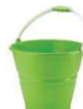
BALDE PLAST. RAINHA 17LT REF. 8155 COLOR