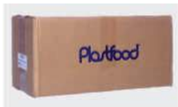
COLHER PLASTFOOD SOBREMESA CRISTAL CX C/1000