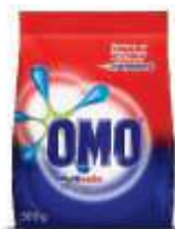
DET.PO OMO M.ACAO TRAD. CX500GR