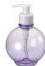
SABONETEIRA BOLA LÍQUIDA 350 ML