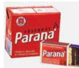
FOSFORO PARANA C/10