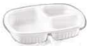
G331 EMB. GALVANOTEK BAND 03DIV C/TP FR/MICR 850ML