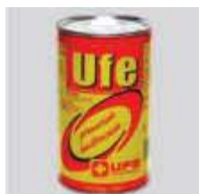
DESINF. UFENOL 750ML