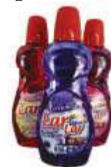
LIMP. LAR DOCE LAR 500ML