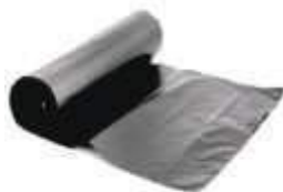
SACO LIXO DINALIX PRETO ROLO 50LTS 30UN