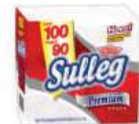
GUARDANAPO PAPEL SULLEG 31X31