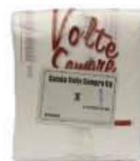
SACOLA PLASTICA 38X50 V.SEMPRE FD C/1000