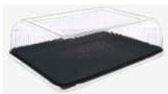
G72M EMB. GALVANOTEK BANDEJA RET. PRETA