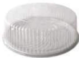
G60M EMB. GALVANOTEK TORTA GRANDE 2,2KG