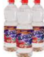
QUEROSENE BUFALO 1LT