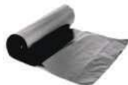
SACO LIXO DINALIX PRETO ROLO 30LTS 30UN