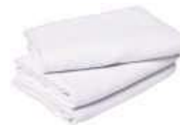
SACO ALVEJADO PANO BOM F12 49X76