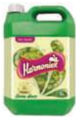
SAB. LIQ. HARMONIEX E.DOCE PEROLADO 5LT