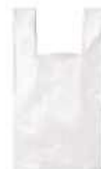
SACOLA PLASTICA 60X80 PCTE 2,5KG