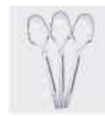
COLHER PRAFESTA SOBREMESA CRISTAL C/50 9980