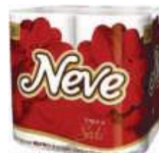
PAPEL HIG NEVE PL. DUPLA 8X30 COMP.