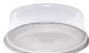
G56M EMB. GALVANOTEK TORTA MEDIA 1,7KG