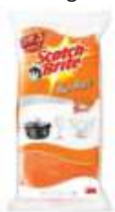
ESPONJA SCOTH BRITE NAO RISCA LV3 PG2