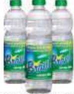
REMOVEDOR BRASIL S/CHEIRO 500ML