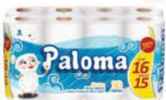
PAPEL HIG PALOMA NETRO F.S. 30MT LV16 PG15