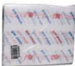
TOALHA AMERICANA MONO IMPRESSA 25X35 C/500UN