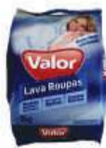
DET.PO VALOR 1KG