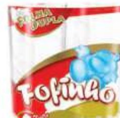
PAPEL HIG FOFINHO FL. DUPLA 4X30 NEUTRO