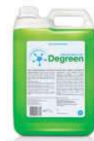
DET. DEGREEN DEENG. 5LT