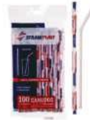
CANUDO STRAWPLAST FLEX SACHE VERM. 6MM C/100 CS- 304