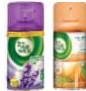
PURIF. BOM AR FRESHMATIC 250ML REFIL