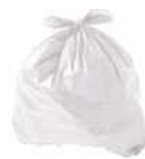
SACO LIXO BRANCO RECICL. 20LTS 100UN