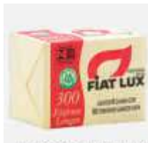
FOSFORO FIAT LUX 6UN