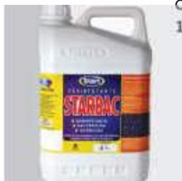
DESINF. STARBAC 5LT