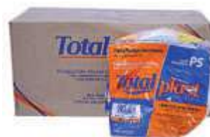
PRATO TOTALPLAST N°15 FUNDO BRANCO C/10