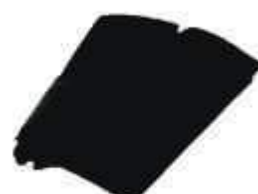
SACO LIXO DINAP. PRETO REFORC. 60LTS