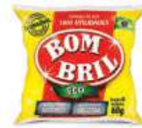
LA DE ACO BOMBRILO 60GR C/08