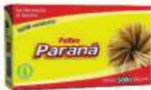
PALITO DENTE PARANA GRANEL C/5000