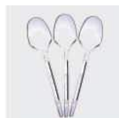
COLHER PRAFESTA REFEICAO PRM CRISTAL CC C/1000 7010