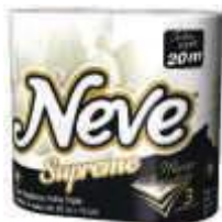
PAPEL HIG NEVE FL. DUPLA 4X20 SUPREME