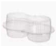
G14 EMB. GALVANOTEK DOIS DOCES MILLEN