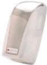
SUPORTE PAPEL HIG. INTERC. EXACCTA BRANDO