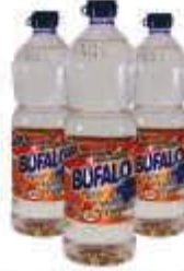
REMOVEDOR BUFALO 1LT