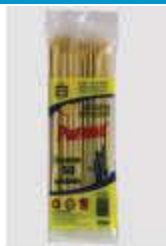
ESPETO BAMBU PARANÁ 18CM C/50