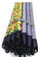
CABO AVULSC RODO/VASSOURA ROSCA PLAS.