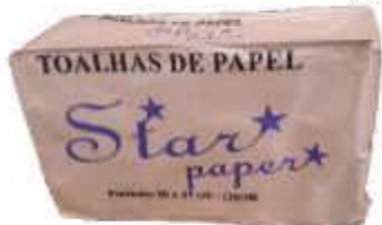
PAPEL TOALHA INTERF STAR PAPER 100% CEL 20X21 C/1000UN