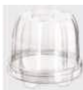
G685 EMB. GALVANOTEK CUPCAKE CONFEITARIA