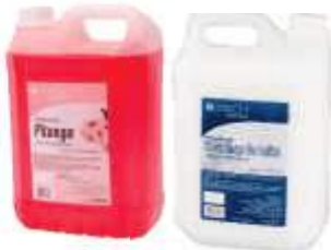
SAB.LIQ. EXACCTA 5LT