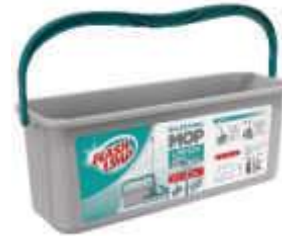
BALDE FLASH LIMP