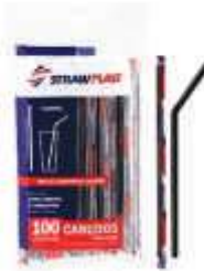
CANUDO STRAWPLAST FLEX SACHE PRETO 6MM C/100 CS- 313