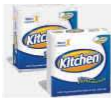
GUARDANAPO PAPEL KITCHEN 33X30 C/50