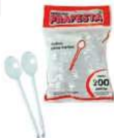
COLHER PRAFESTA LITTLE COFFE CRISTAL C/200 8721