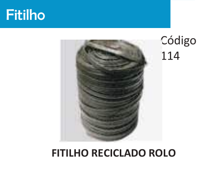
FITILHO RECICLADO ROLO