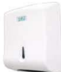
TOALHEIRO PLAST. TRILHA INTERFOLHA