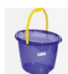
BALDE PLASNEW OVAL 8LT REF.7080