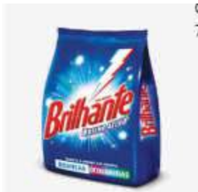
DET.PO BRILHANTE AZUL SACHET 1KG