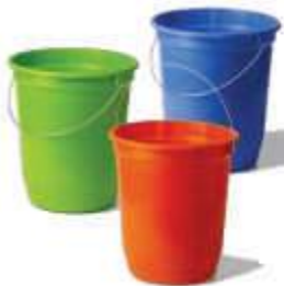
BALDE PLASNEW 14LT REF. 180