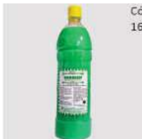
DET. DEGREEN DEENG. 1LT