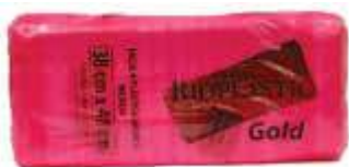
SACOLA PLAST. RIOPLASTIC 38X48 GOLD BCA. CX C/1000