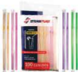
CANUDO STRAWPLAST FLEX SACHE NEON 6MM C/100 CS- 312