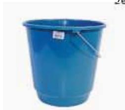
BALDE ARQPLAST 15LT REF. BF15