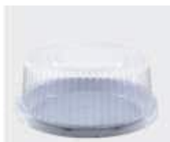
G32M EMB. GALVANOTEK TORTA MINI MILLEN MD 750GR