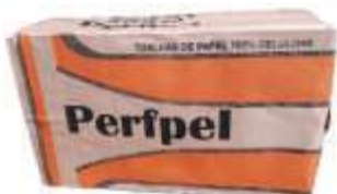
PAPEL TOALHA INTERF PERFPEL 100 CEL 20X21 C/1000UN