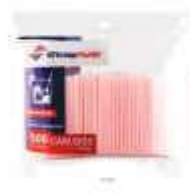
CANUDO STRAWPLAST DRINK VERM. C/500 CS-220