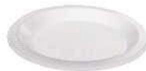
PRATO COPOPLAST N° 26 RASO BRANCO C/10