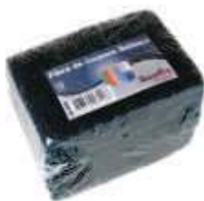
FIBRA LIMP. BETTANIN BETTACO 125X87 10UN