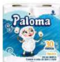
PAPEL HIG PALOMA NEUTRO F.S. 4X30MT