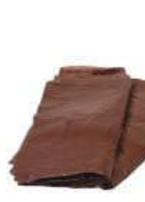
SACO LIXO COMUM MARROM 60LTS 100UN