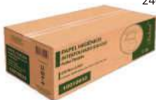
PAPEL HIG INDAIAL CAI CAI F.S.CX C/10000 E. LUXO