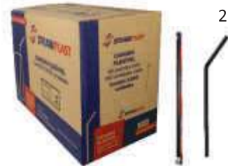
CANUDO STRAWPLAST FLEX PRETO 6MM CX/3000 CS-200P