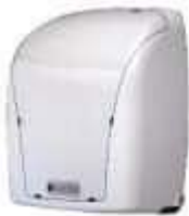
TOALHEIRO PLAST. EXACCTA INTERF. BRANCO