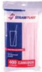
CANUDO STRAWPLAST COMUM VERM 4MM C/400UN CC-001