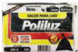
SACO LIXO PRETO POLILUZ 50LTS C/10