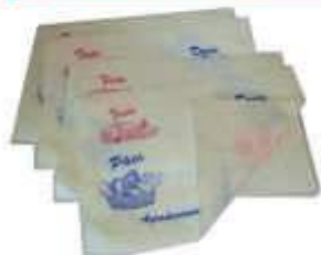
PAPEL ACOPLADO FRIOS 30X38 MONO