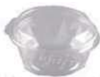
G640D EMB. GALVANOTEK UM DOCE RED 170ML DIAM