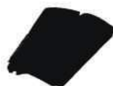
SACO LIXO DINAP. PRETO REFORC. 100LTS 100UN