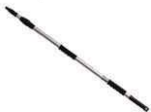
CABO EXTENSOR BETTANIN C/ROSCA