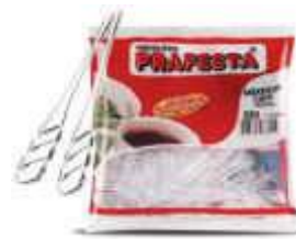
MEXEDOR CAFÉ PRAFESTA CRISTAL C/250 8755