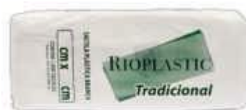
SACOLA RIOPLASTIC 40X50 BCA. CX C/1000