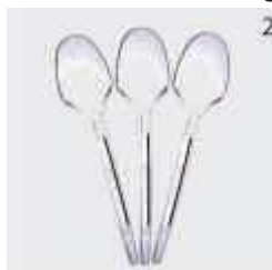
COLHER PRAFESTA REFEICAO PRM CRISTAL C/50 7030