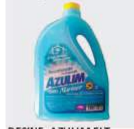
DESINF. AZULIM 5LT