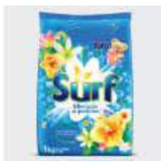
DET.PO SURF SC 1KG