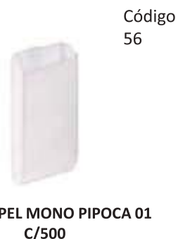
SACO PAPEL MONO PIPOCA 01 C/500