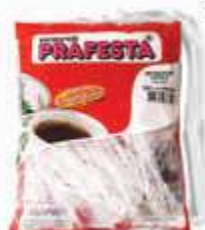
MEXEDOR DRINK PRAFESTA CRISTAL C/200 8760