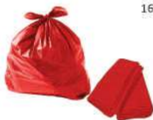
SACO LIXO VERMELHO REFORC. 15LTS