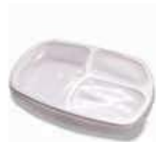
G330 EMB. GALVANOTEK BAND 03DIV C/TP FR/MICR 1150ML