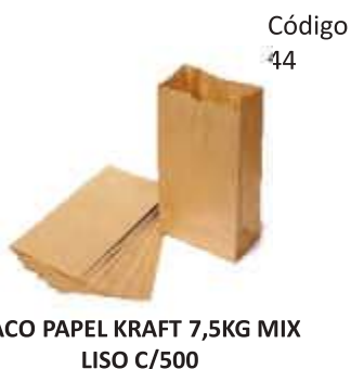
SACO PAPEL KRAFT 7,5KG MIX LISO C/500