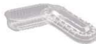
G07 EMB. GALVANOTEK MULTIUSO 200ML 10UN