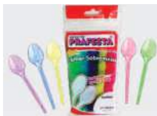
COLHER PRAFESTA SOBREMESA COLOR C/200 8952