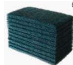
FIBRA LIMP. BETTANIN LIMP. PESADA 102X260 UN