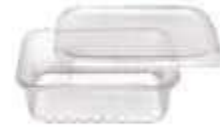
POTE PRAFESTA RET. 700ML C/TP TRANSP. C/24 8316