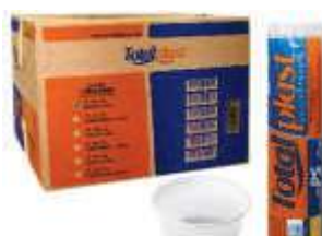
POTE DESC. TOTALPLAST 100ML C/100