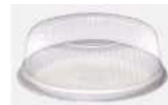
G37MB EMB. GALVANOTEK TORTA PEQ. 1KG BAIXA