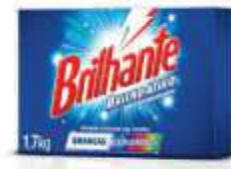
DET.PO BRILHANTE AZUL CX 1,700KG