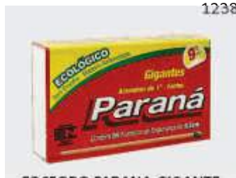
FOSFORO PARANA GIGANTE