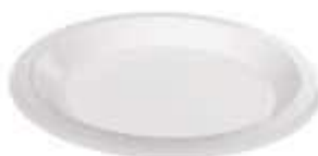
PRATO COPOPLAST N° 26 FUNDO BRANCO C/10