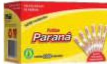
PALITO DENTE PARANA SACHE C/2000