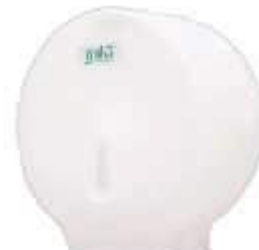
SUPORTE PAPEL HIG. ROLAO TRILHA 300/600 MTS