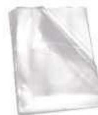
SACO PLASTICO VIRGEM BD 10X20