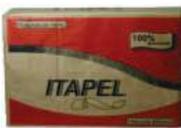
PAPEL TOALHA INTERF ITAPEL BRANCO 21X23 C/1000UN