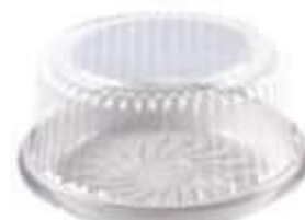
G56MA EMB. GALVANOTEK TORTA MEDIA ALTA 202 KG