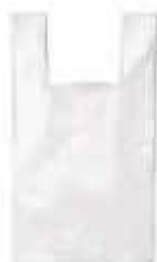
SACOLA PLASTICA 50X60 PCTE 2,5KG