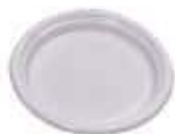
PRATO COPOPLAST N°18 RASO BRANCO C/10