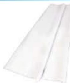
TOALHA MESA PEROLIZ. 80X80 10 UM BCA