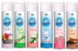
PURIF. ULTRA FRESH AERO 360ML