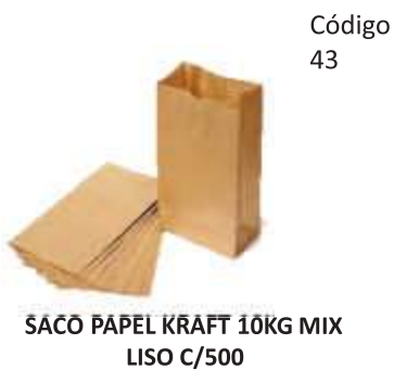
SACO PAPEL KRAFT 10KG MIX LISO C/500