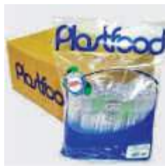
MEXEDOR CAFÉ PLASTFOOD C/500