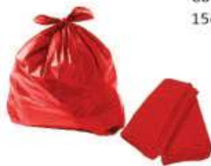
SACO LIXO VERMELHO REFORC. 60LTS