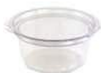
G750D EMB. GALVANOTEK POTE RED TP ARTIC. DIAM. 350ML